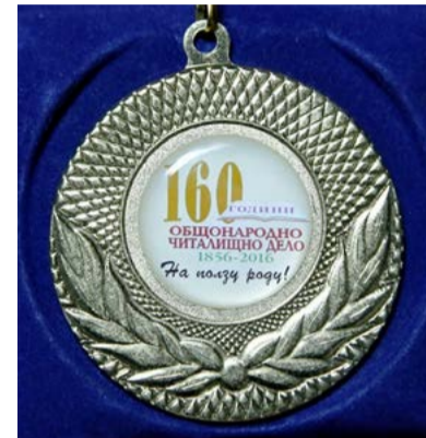
Златна лира и Почетен знак на СНЧ – за читалището по повод на юбилея