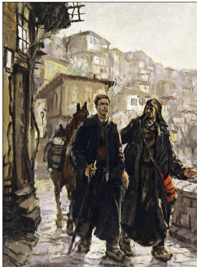
„Васил Левски и Миткалото“, 1968 г.

* Публикувано от Виртуална библиотека „СЛОВОТО“ (www.slovo.bg).