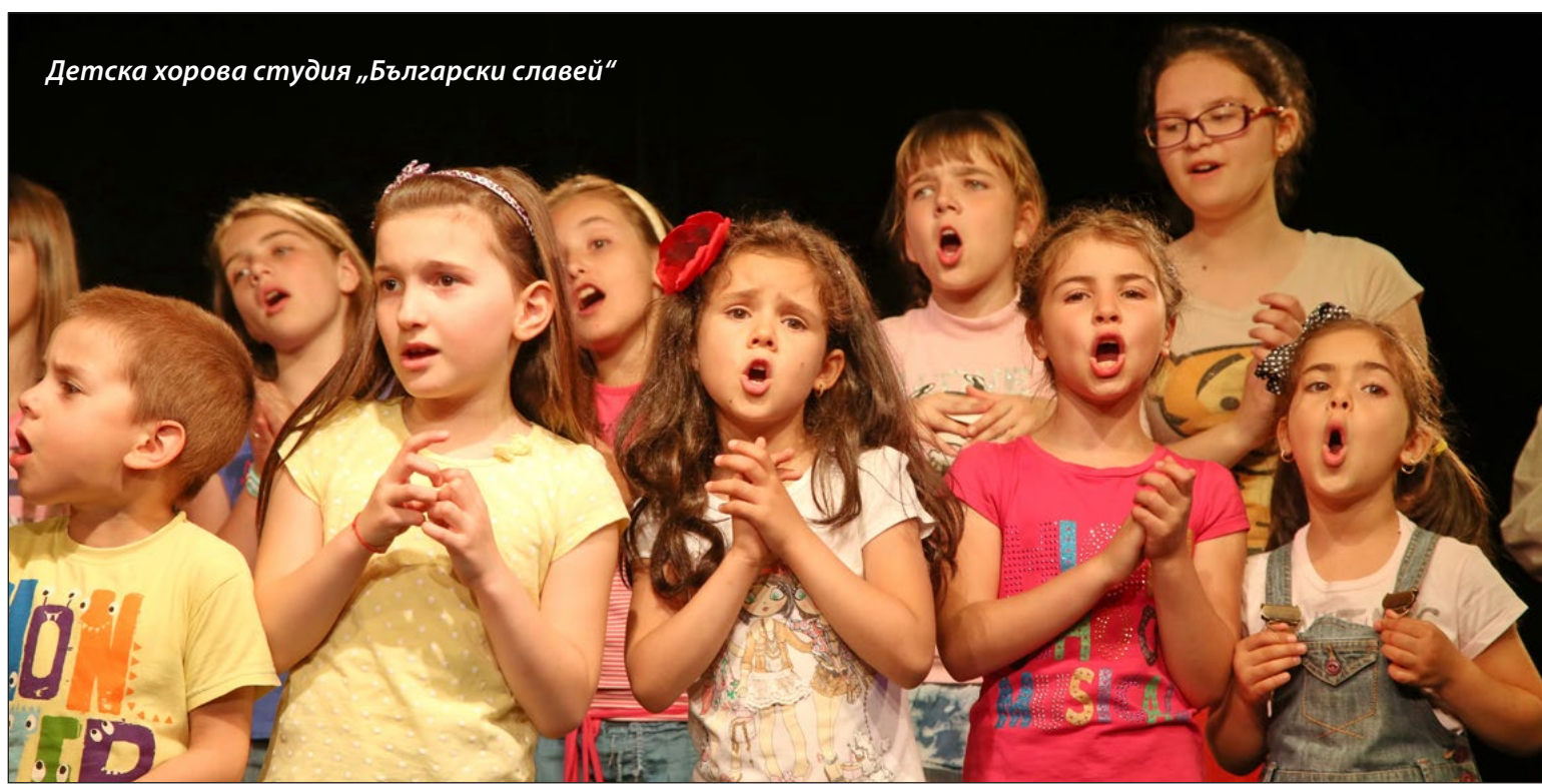
Детска хоров студия „Български славеи“

От Настоятелството на НЧ „Д-р П. Берон – 1926 г.“