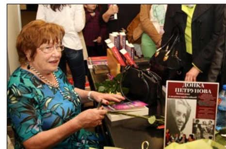
Всеки бързаше да получи автограф