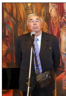
Банко П. Банков