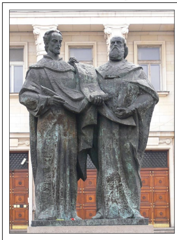
Паметник на двамата братя пред Национална библиотека „Св. св. Кирил и Методий“, София

Искам да подчертая: културата на народа, духовната култура на народа – това е жив организъм и като всеки организъм тя придобива жизнена стойност, способност да понесе всички изпитания само в общуването със заобикалящата я среда. За организма общуването със средата е основата на живота. Ето защо всеки стремеж към тесен национализъм ще отдели организма от заобикалящата го среда. Национализмът е равен на смъртна присъда и означава, че носителите на идеите на национализма не вярват в жизнеността на своя народ. Истинският патриотизъм не се бои от общуването с културите на другите народи. Сега много говорим за биологическата екология. Време е да се заемем с проблемите на духовната, културната екология. Константин-Кирил, Методий и техните ученици като са създавали българската държава на духа, са създали едновременно и културно-екологическата среда, в която тази държава трябвало да влезе, в която трябвало да живее. Те са създали такова направление на българската култура, което осигурило трайното и съществуване през годините на чуждестранното иго. Българската държава на духа продължава да живее в другите славянски страни и в тяхното ръкописно наследство.