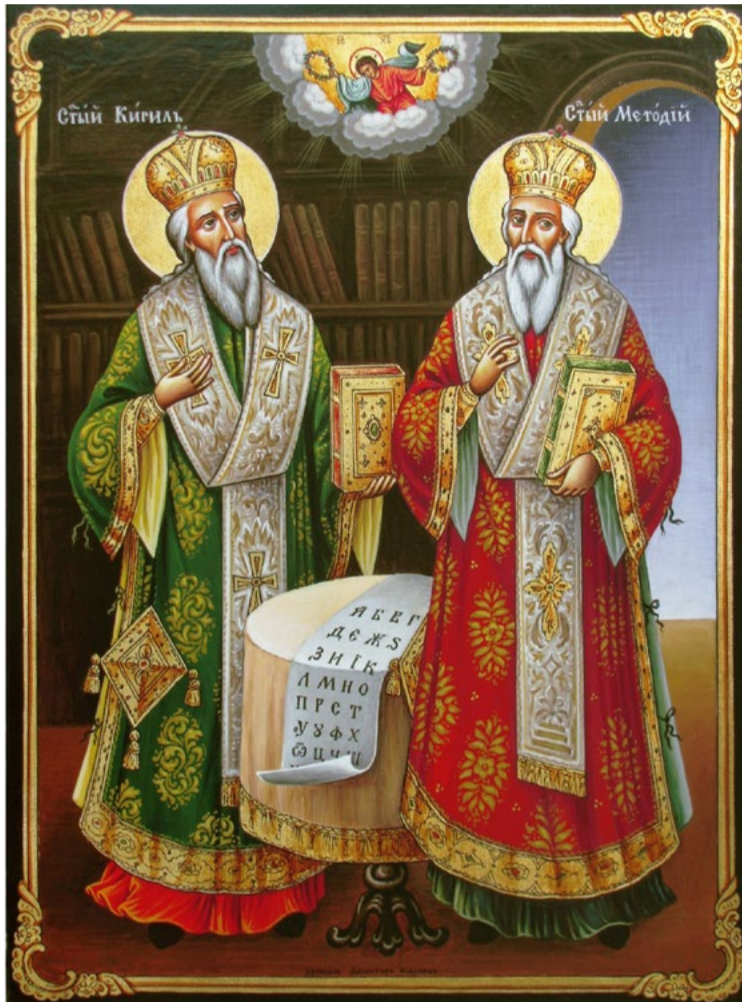
Художник Димитър Малчев

...Както културата* на народа бива материална и духовна, така също има държава външна, материална, с армия, която охранява страната, управлението и т. н., и държава духовна, държава на духа. Външната, материалната държава с нейната военна сила и държавна независимост е била създадена от Аспарух. Държавата на духа в основата си е била създадена от Кирил и Методий. Разбира се, създаването на българската държава на духа е започнало още по-рано, преди Кирил и Методий – тогава, когато прабългарите са се славянизирани, когато са овладели славянския език и са станали българи. Но главните създатели на българската държава на духа са Кирил и Методий, защото и за духовната култура е необходима материална форма и, на първо място, увековеченото чрез писмеността българско слово. С други думи, писмеността