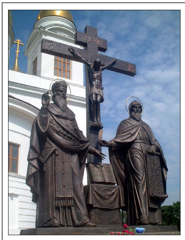
Паметник на светите братя Кирил и Методий в Самара, Русия