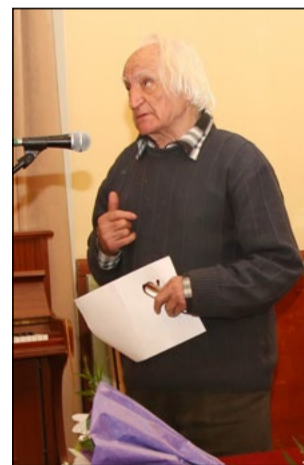
Банко П. Банков