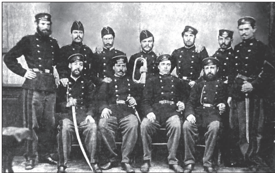
Участници във Втората българска легия в Белград 1868 г., сред които вторият седнал, отдясно наляво, е Васил Левски

Къде е днес мястото на чистото и смелото сърце? Мястото на чистото и смелото сърце е там, където е отечеството. Там, където е народът. Там, където е доброто. Там, където е правдата. Чистото и смелото сърце търси, намира и изявява истината за историята и за времето, в което живее. Истината, която разбива на пух прах и най-екзотичните „нови прочити“ и интерпретации. Истината, която го прави свободен. Чистото и смелото сърце се обрича и врича на свободата, изпълнявайки заветите на предците. „Аз съм се обещал на отечеството като жертва за освобождението, а не да бъда кой знае какъв“ – пише Левски, революционерът, в писмо от март 1871 г. до войводата Филип Тотю. „При всички случаи