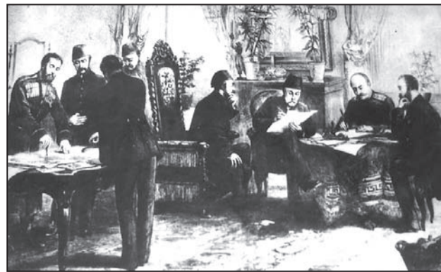
Подписването на Сан-Стефанския мирен договор