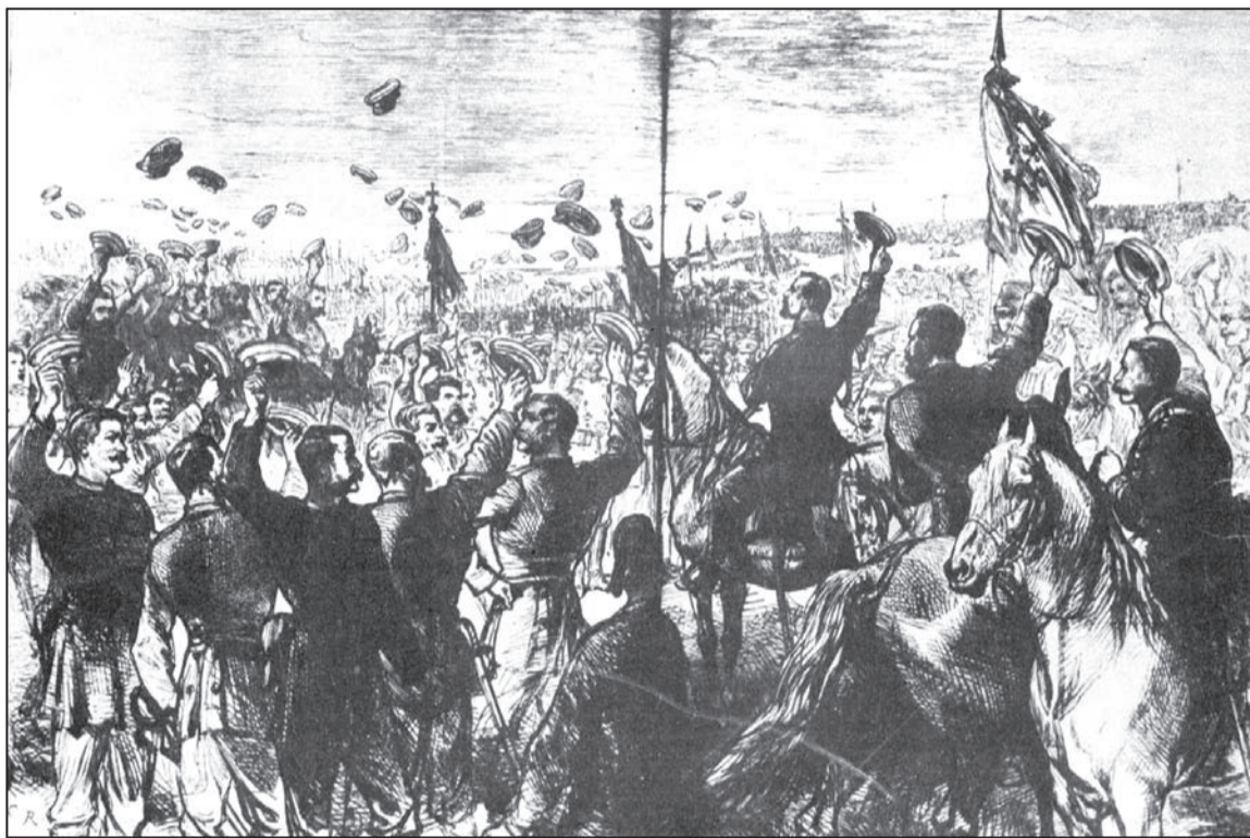
Санстефанският мирен договор е подписан. Парад в Сан Стефано. 3 март 1878 г.

Формулата на руския посланик ген. Николай Павлович Игнатиев, изречена по време на Цариградската конференция, изразява готовността на Русия да освободи поробените славянски православни братя от петвековното робство и „да върне дълг си на родината на просветителите Кирил и Методий“. За него политиката не е само „интереси“, но и „симпатии“.