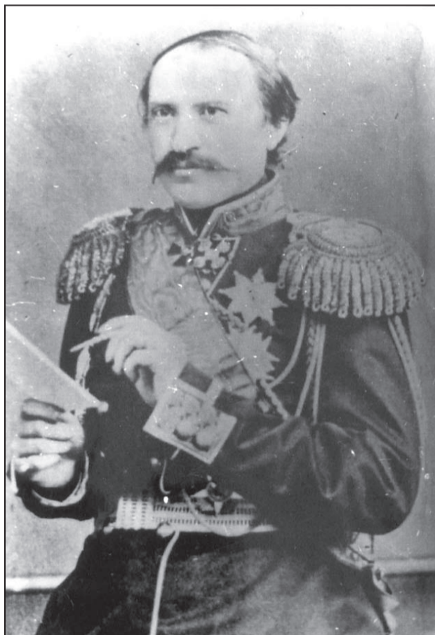
Граф Игнатиев, току-що назначен за посланик на Русия в Османската империя, 1964 г.

И ето, след петвековно робство, България дочаква такава личност да се появи на дипломатическия пост